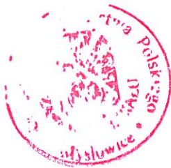
Tabela wchodzi w życie z dniem podjęcia.

Wykonanie Tabeli powierzyć dyrektorowi MZOPO.